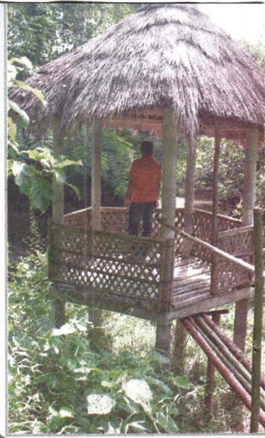
'বাবুই' নামে এই ঘর যেতে হয় বাঁশের সেতু পেরিয়ে।

নিসর্গ নীরব ইকো-কটেজটি বাইরে থেকে দেখলে মনেই হবে না ভেতরে কী চমক অপেক্ষা করছে। কটেজটির পরতে পরতে চমক আর চমক। মূল কটেজের পেছনের অংশে রয়েছে একাধিক বাঁশ-বেত ও ছনের তৈরি ছোট ছোট ঘর। 'বাবুই' নামে একটি ঘরে যেতে হয় বাঁশের সেতু পেরিয়ে। এর পাশেই অপর একটি বাঁশের সেতু পেরিয়ে লেবু বাগানের ভেতরে গিয়ে দেখা