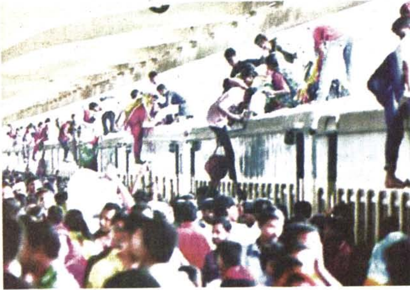
ঈদ শেষে কর্মস্থলে ফিরতে বরাবরের মতো মানুষকে নৌ, রেল ও সড়ক পথে দুর্ভোগ পোহাতে হয়েছে। ছবিতে এভাবেই জীবনের ঝুঁকি নিয়ে বিলম্বিত যাত্রায় ফিরছে মানুষ

অন্ধ্র-উড়িষ্যা প্রদেশে আছড়ে পড়েছে হুদহুদ ভারতের অন্ধ্র প্রদেশ ও উড়িষ্যার উপকূলে আছড়ে পড়েছে শক্তিশালী ঘূর্ণিঝড় হুদহুদ। ১২ অক্টোবর বেলা ১১টার দিকে ১৯০ কিলোমিটার বেগে হুদহুদ আছড়ে পড়ে অন্ধ্র