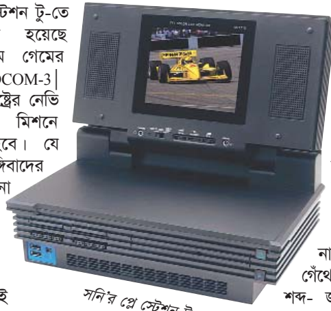
সনির প্লে স্টেশন টু

সনির প্লে-স্টেশন টু-তে সম্প্রতি যোগ হয়েছে জনপ্রিয় সোকম গেমের তৃতীয় ভার্সন SOCOM-3। গেমটিতে যুক্তরাষ্ট্রের নেভি হিসেবে বিভিন্ন মিশনে অংশ নিতে হবে। যে তিনটি দেশে জঙ্গিবাদের ঘাঁটি দেখানো হয়েছে তা হলো মরক্কো, বাংলাদেশ ও পোল্যান্ড। একশনধর্মী এই গেমের কমাডো