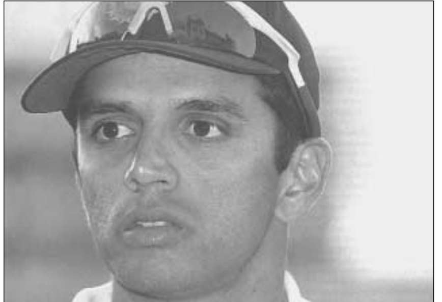
রাহুল দ্রাবিড় : ভারতের ব্যাটিং স্তম্ভ, একাই বদলে দিতে পারেন অনেক কিছু

সফরে দারুণ খেললেও পরে ফর্ম হারিয়ে বাদ পড়েছিলেন দল থেকে। দলে একমাত্র অভিজ্ঞ কার্ল হুপার ছাড়া তেমন আর কেউ নেই যে, দ্বিতীয় জনের নাম আসতে পারে। দলের বাকিরা সবাই তরুণ। এক ঝাঁক তরুণ নিয়ে কার্ল হুপারের দল কিভাবে সামলাবে সৌরভ