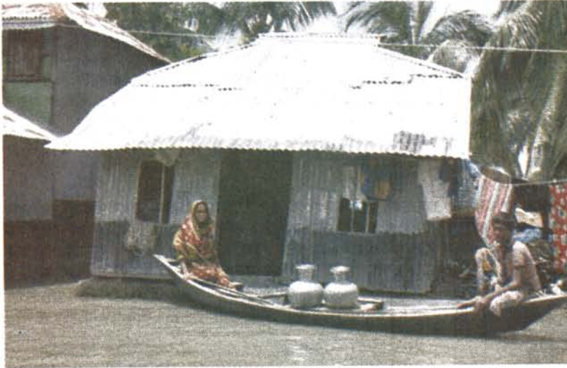
পটুয়াখালীর বন্যাদুর্গত এলাকা