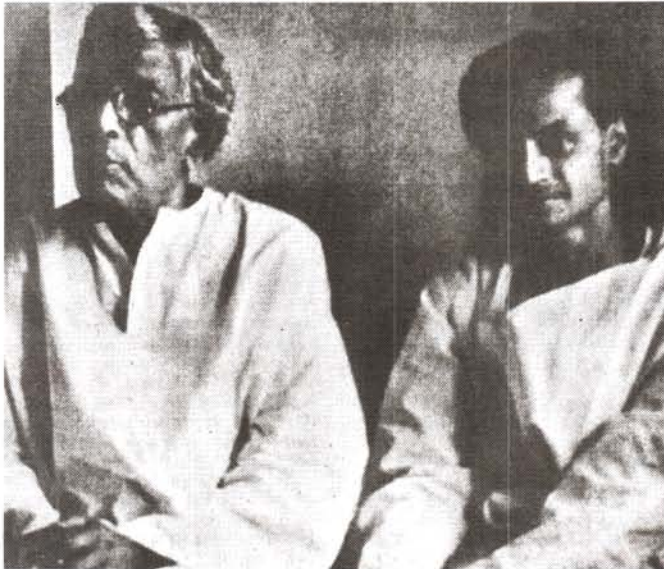
এক ঘনিষ্ঠ মুহূর্তে উপমহাদেশের বিখ্যাত চিত্রশিল্পী যামিনী রায় (১১ এপ্রিল, ১৮৮৭-২৪ এপ্রিল, ১৯৭২ বায়ে) ও কবি বুদ্ধদেব বসু (৩০ নভেম্বর, ১৯০৮-১৮ মার্চ, ১৯৭৪)। পিতৃস্থানীয় শিল্পী যামিনী রায়ের সঙ্গে বুদ্ধদেব বসুর ছিল ঘনিষ্ঠ বন্ধুত্বের সম্পর্ক