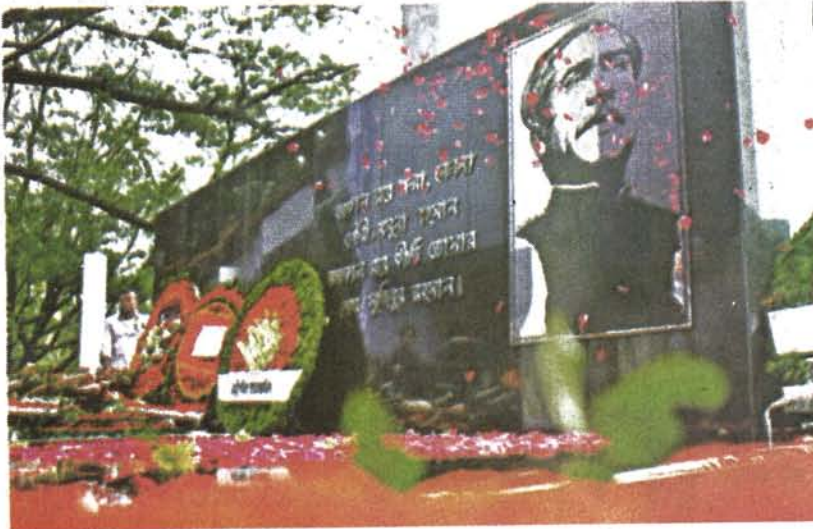
জাতীয় শোক দিবসে বঙ্গবন্ধুর প্রতিকৃতিতে শ্রদ্ধাঞ্জলি

সপরিবারে বঙ্গবন্ধুকে হত্যার মধ্য দিয়ে এই দিনে বাঙালির ইতিহাসে এক কালিমালিপ্ত অধ্যায় রচিত হয়েছিল। কতিপয় চক্রান্তকারী সেনাসদস্য ১৯৭৫ সালের এই দিনে নৃশংসভাবে স্বাধীন বাংলাদেশের স্বপ্নটি ও স্বাধীনতা সংগ্রামের মহানায়ক শেখ মুজিবুর রহমানকে সপরিবারে হত্যা