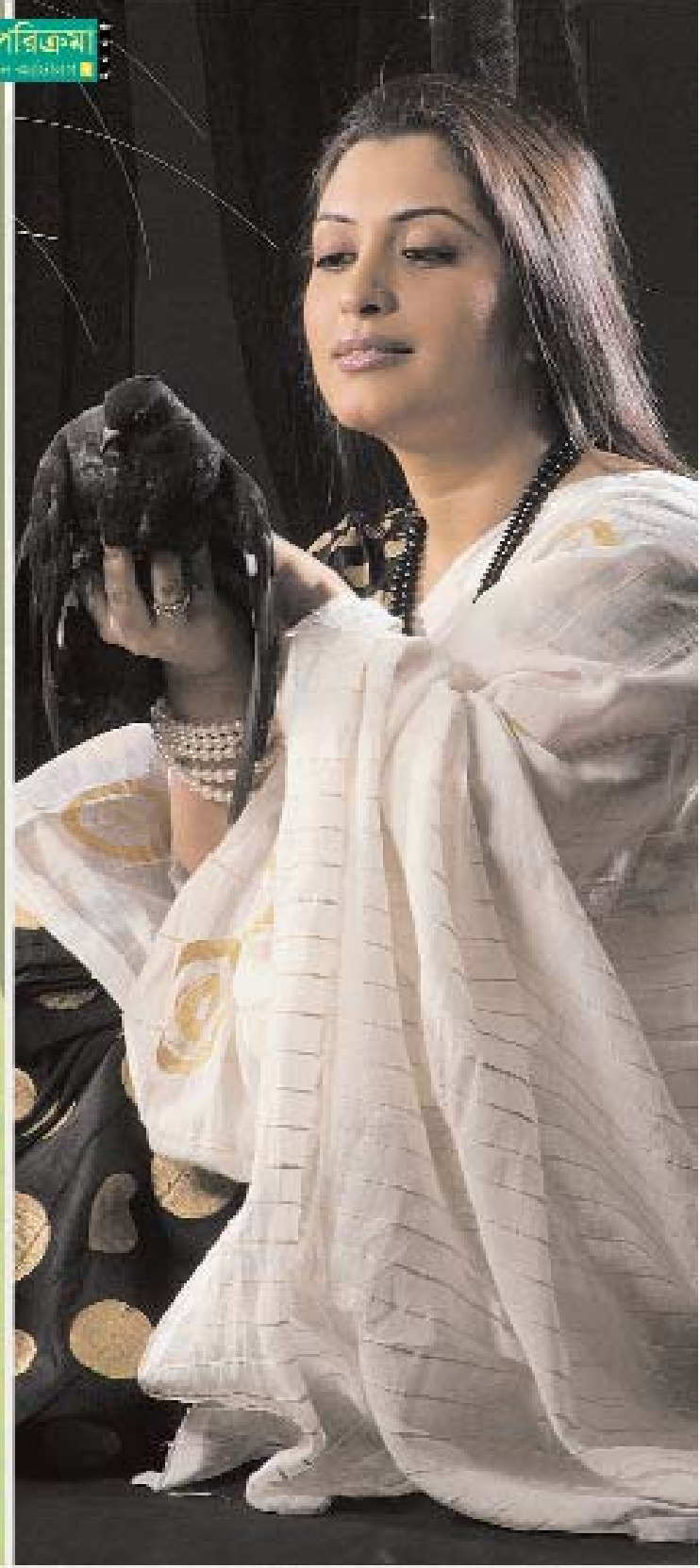
◆ বিপাশা পরেছেন রঙ-এর শাড়ি।