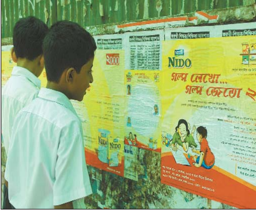
১০০ স্কুলে কর্মীরা সরাসরি লিফলেট, পোস্টারসহ প্রচার কাজ চালান।

নারায়ণগঞ্জ, সাভার, গাজীপুরের স্কুলে প্রচার কাজ চালান। ঢাকার প্রায় ১ হাজার স্কুল এবং নারায়ণগঞ্জ, টঙ্গী, সাভার গাজীপুরের প্রায়