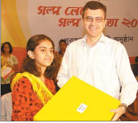
cj`vi w`f`Ob tbnkj`e`sj`v`k`ij`ug`U`W`i e`e`icbr`cwi`Pij`K`K`ij`P`i`nd`q`j`v`