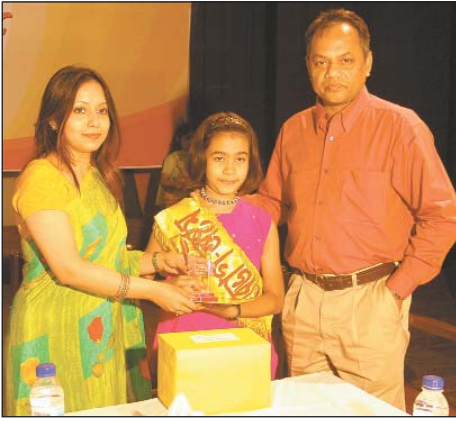
cj`vi w`f`Ob tbnkj`e`sj`v`k`ij`ug`U`W`i e`v`U`g`i`fb`Rvi`b`Rnv`Z`BDm`p`G`es K`_v`m`w`n`u`z`K`Bg`v`j`n`K`u`g`j`b`