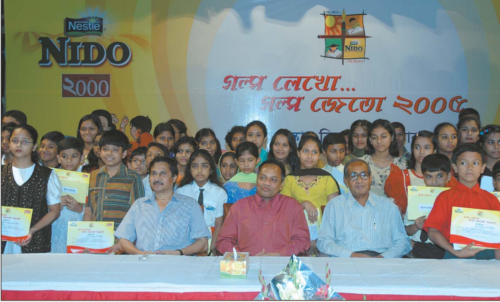
নিডো সাপ্তাহিক ২০০০ ‘গল্প লেখো... গল্প জেতো’ ২০০৫