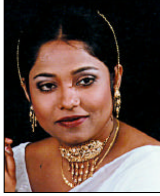
ফোক গানে জনপ্রিয় ডলি