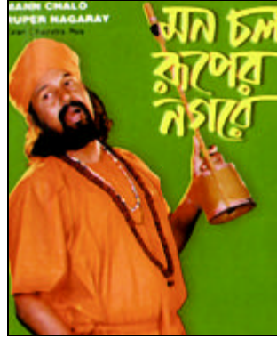
অডিও বাজারের বড় অংশ লোকজ গানের। বাজারের মূল ধারা