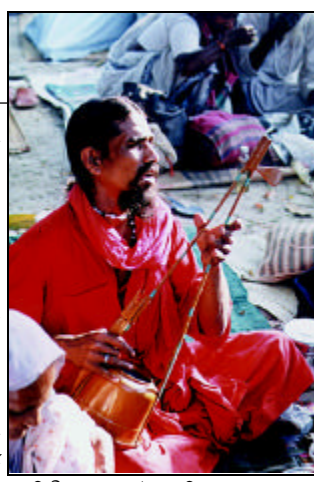
পৃথিবীর সবদেশেই জনপ্রিয় লোকজ সুর। বিটিভির জনপ্রিয় এক অনুষ্ঠান ছিল মরমী