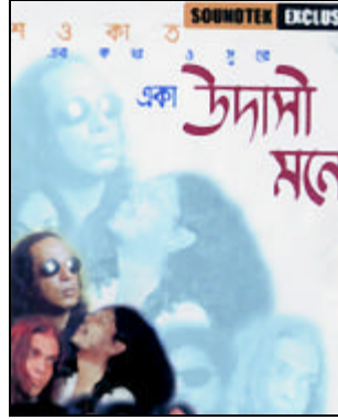
ব্যাড ক্যাসেটের মূল ক্রেতা মেট্রো প্রজন্ম। প্রতিযোগিতা তিনটি গ্রুপে