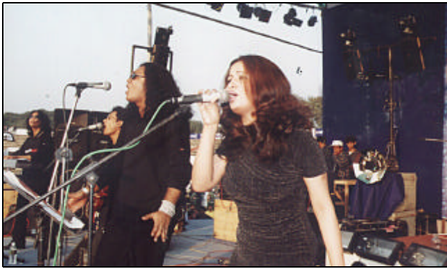
নগর বাউলেরাও তরুণদের হার্টথ্রব। লোকজ গান করে জনপ্রিয় হয়েছে অধিকাংশ গ্রুপ