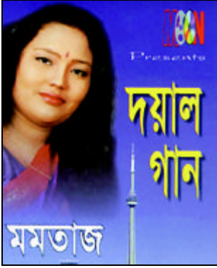
মমতাজের ৬শ ক্যাসেটে ৫ হাজার গান। হাজার কোটি টাকার ক্যাসেট বিক্রি