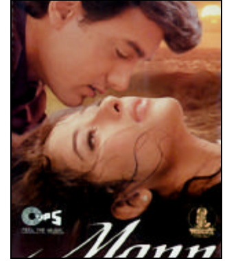
বাংলাদেশী যে কোনো শিল্পীর একক ক্যাসেটের তুলনায় হিন্দি ক্যাসেট চলে বেশি