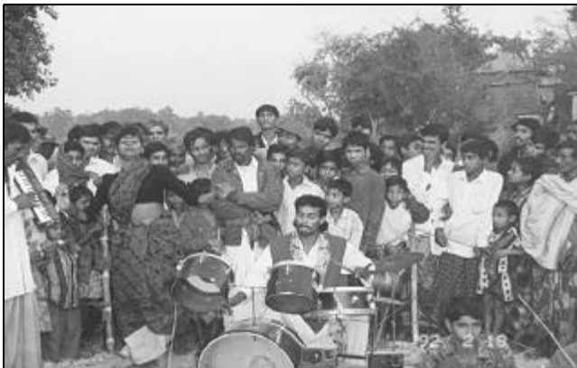
বদলে যাচ্ছে লোকজ সংস্কৃতির মূলধারা

পৃথিবীর সব দেশেই সবচে' জনপ্রিয় তার লোকজ সুর, লোকজ গান। বিটিভির দর্শক জরিপে সবচে' জনপ্রিয় অনুষ্ঠান মরমী অথবা হিজল তমাল, একুশে টেলিভিশনের যেমন বাউলিয়ানা। এটাই চিরায়ত ধারা।