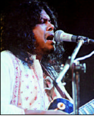
জেমস : এক গান গেয়ে সম্মানী ১ লাখ +